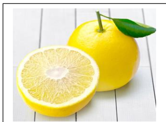
土佐文旦（1つ 300円から～）

20歳未満の者の飲酒は法律で禁止されています 20歳未満の者に対しては酒類を販売しません