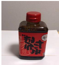
万能たれで、テレビで紹介されました。 800円