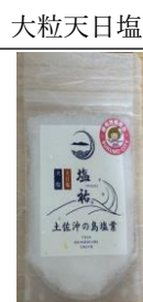
沖ノ島 塩祐 500円