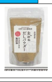
宗田節だしパウダー 50g 390円税